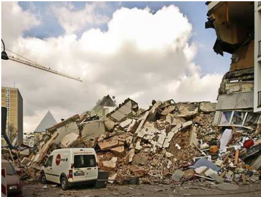
Kölner Stadtarchiv nach dem Einsturz

Zum Jahrestag des Archiveinsturzes 2009 veranstalten wir in Zusammenarbeit mit „Köln Kann Auch Anders“ einen Abend am Mittwoch 29.02. 2012 um 20.00 Uhr im Friedensbildungswerk Obenmarspforten 7-11, 50667 Köln-Altstadt / Eintritt frei