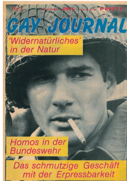
▲ Die kleine Szenezeitschrift Gay Journal widmete in ihrer Februar-Ausgabe 1984 der Bundeswehrraffäre und den homosexuellen Soldaten fünf volle Seiten.

Laut FAZ war 1998 ein Oberleutnant von seinem Dienstposten als Zugführer in einem Objektschutzbataillon der Luftwaffe abgelöst und in einen Stab versetzt worden »nachdem der MAD von seiner homosexuellen Neigung erfahren hatte«. Der Oberleutnant klagte bis vor das Bundesverfassungsgericht. »Die Zeit« brachte es schon 1984 auf