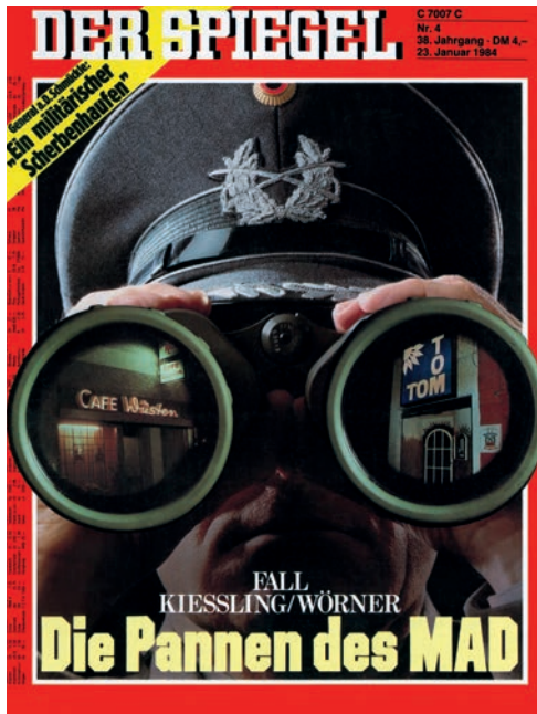
▲ Der Wörner-Kießling-Skandal füllte im Januar 1984 drei Spiegel-Titel.

gericht befand den Hauptfeldwebel eines Dienstvergehens für schuldig und erkannte gegen ihn auf Entfernung aus dem Dienstverhältnis. Der Wehrdienstsenat des Bundesverwaltungsgerichts bestätigte das erstinstanzliche Urteil: »Gleichgeschlechtliche Handlungen zwischen Angehörigen der Bundeswehr sind und bleiben – unabhängig von der inzwischen durch die Abschaffung des § 175 StGB bisheriger Fassung zum Ausdruck gekommenen Änderung ihrer strafrechtlichen Wertung – für eine so enge Männergemeinschaft, wie sie die Armee darstellt, unerträglich [...] Höher zu veranschlagen ist die Gefahr einer Störung der inneren Ordnung, die von Disziplin und Autorität getragen werden muss.«