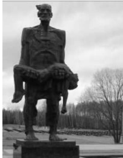
„Der nicht zu unterwerfende Mensch“

Kalter Wind zieht über das in einem Wald gelegene Stück Land. Außerdem beginnt es zu regnen. Das Wetter scheint die bedrückende Stimmung, welche BesucherInnen