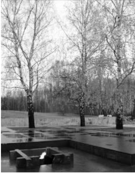
Die „ewige Flamme“

Die über 400 Dörfer, die im Krieg zwar „verbrannt“, allerdings wieder aufgebaut wurden, werden nicht vergessen. Sie finden hinter dem Friedhof ihre Gedenkstätte. Ihre Namen bilden die „Äste“ der „Bäume des Lebens“.