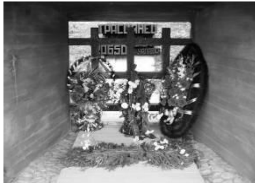
Eine Nische in der Gedenkmauer erinnert an die Opfer des Vernichtungslagers Trostenc.

Chatyn' noch die Erinnerung an die Massenvernichtungslager auf belarusischem Boden integriert. Die Andenkenmauer befindet sich im hinteren Teil der Gedenkstätte. In den Nischen der Mauer stehen hinter einem Gitter die Namen der jeweiligen Vernichtungsstätten und die Zahl ihrer Opfer. In den Nischen vor den Gittern stehen Blumen und Blumenkränze. Die ersten beiden Nischen sind besonders auffällig, hier stehen immer viele Spielzeuge und Kuscheltiere, da sie an Kinderkon-