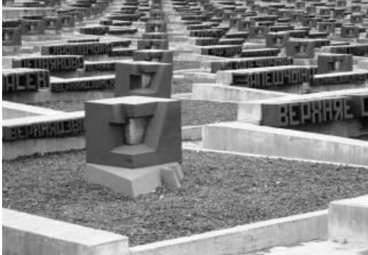
Der „Friedhof der Dörfer“

symbolisch dargestellt. An jedem Obelisken hängt ein Schild, auf dem zu lesen ist, wer in den Häusern gelebt hat. Hinter den Namen der Kinder, die zum Zeitpunkt des Überfalls auf Chatyn' jünger als sechzehn Jahre alt waren, ist das jeweilige Alter angegeben. Die offene Zauntür, die die BesucherInnen dazu aufruft, sich den