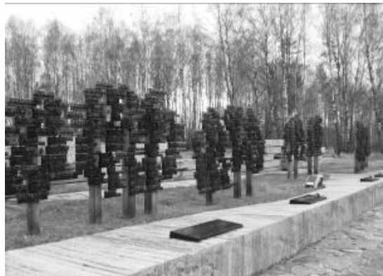
Die „Bäume des Lebens“

Folgt man dem Weg weiter, fällt eine große, in Stein gehauene 186 auf. Sie steht für die 186 verbrannten Dörfer in Belarus', die nach dem Krieg nicht mehr aufgebaut wurden. Auf dem daneben gelegenen sogenannten „Friedhof der Dörfer“ liegen diese „getöteten“ Dörfer „begraben“. Jedes der zerstörten Dörfer hat sein eigenes Grab. Am Kopfende jedes „Grabes“ ist der Name des Dorfes und des Rayons, dem es angehörte, in Stein gemeißelt. In der Mitte jedes „Grabes“ steht ein „Flammensockel“. Er symbolisiert, daß das Dorf den Flammen zum Opfer gefallen ist. Auf diesem „Flammensockel“ steht außerdem eine Urne, in der sich Erde aus dem jeweiligen Dorf befindet. So finden die verbrannten