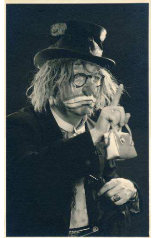
Abbildung: Küpper Copyright: Gerhard A. Küpper

26. Januar 2011, 20 Uhr (Premiere) „DER STEIN“ von Marius von Mayenburg Eine Produktion von ensemble 7